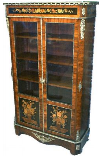
Vitrine Napoléon III à marqueterie de fleurs