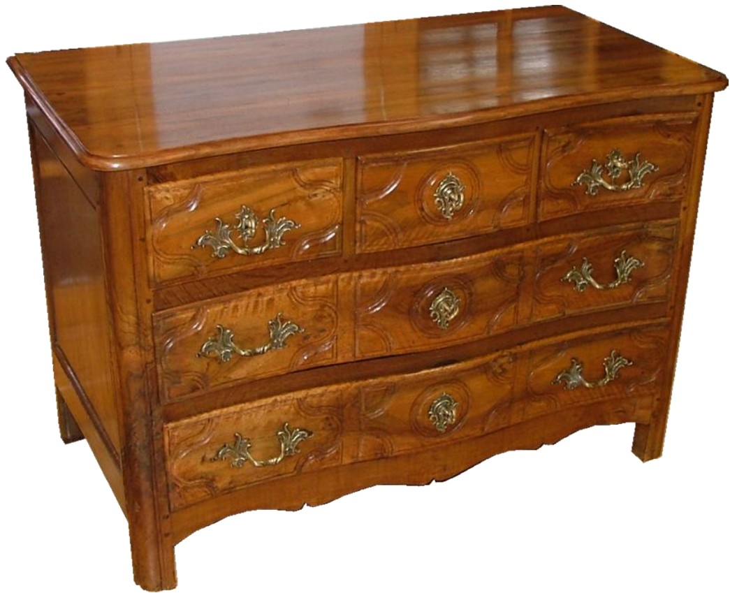
Commode parisienne d'époque Louis XV