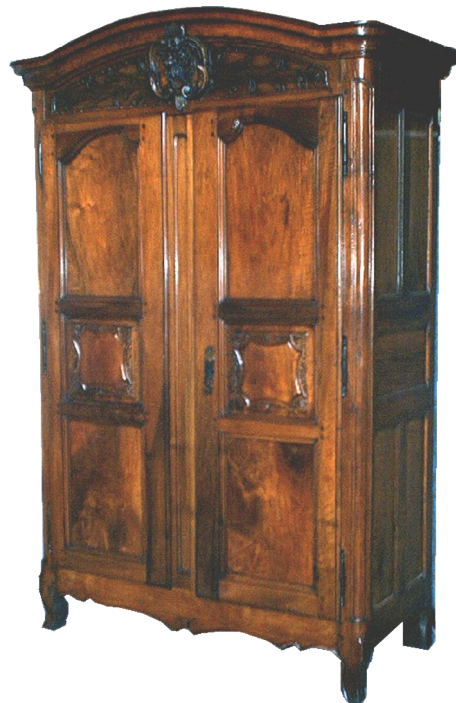
Armoire lyonnaise d'époque Louis XV