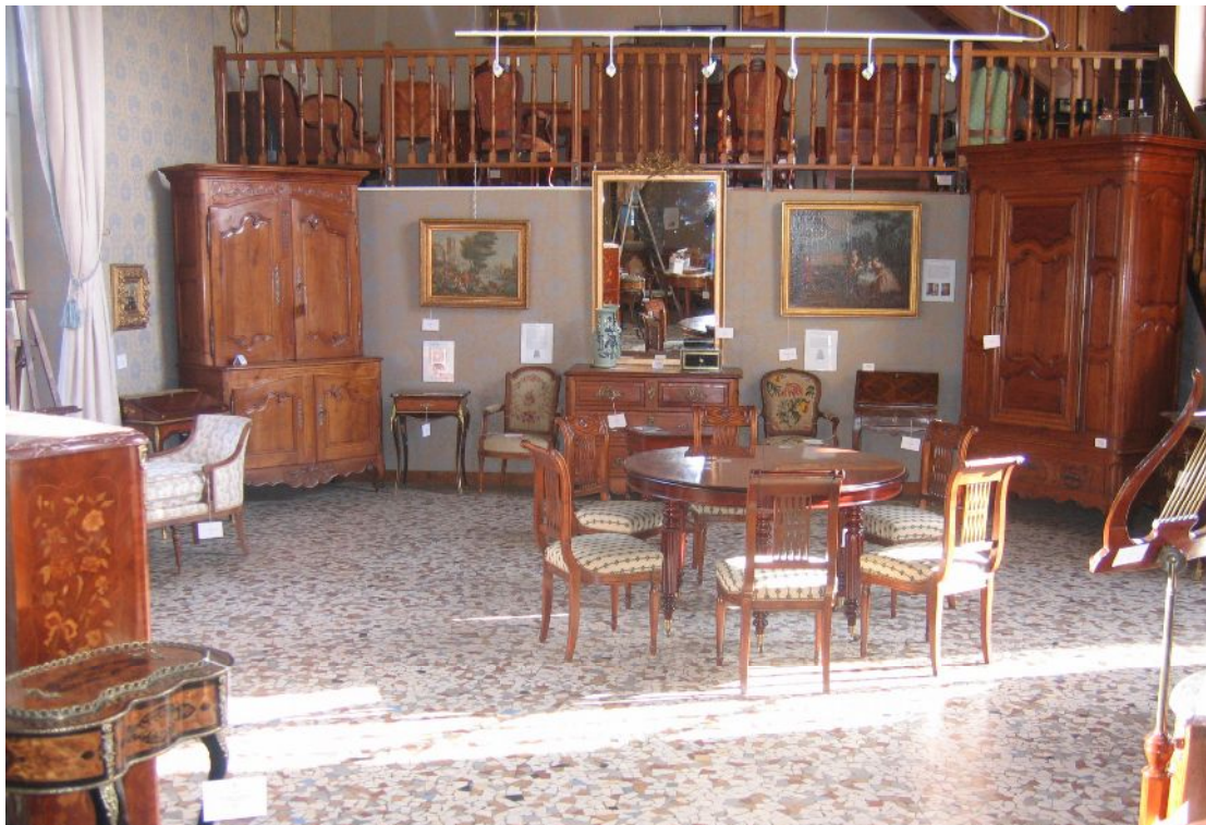
Vue d'une salle d'exposition