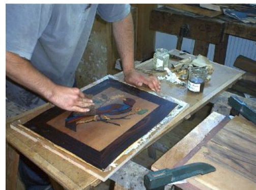
Stage d'initiation à la marqueterie