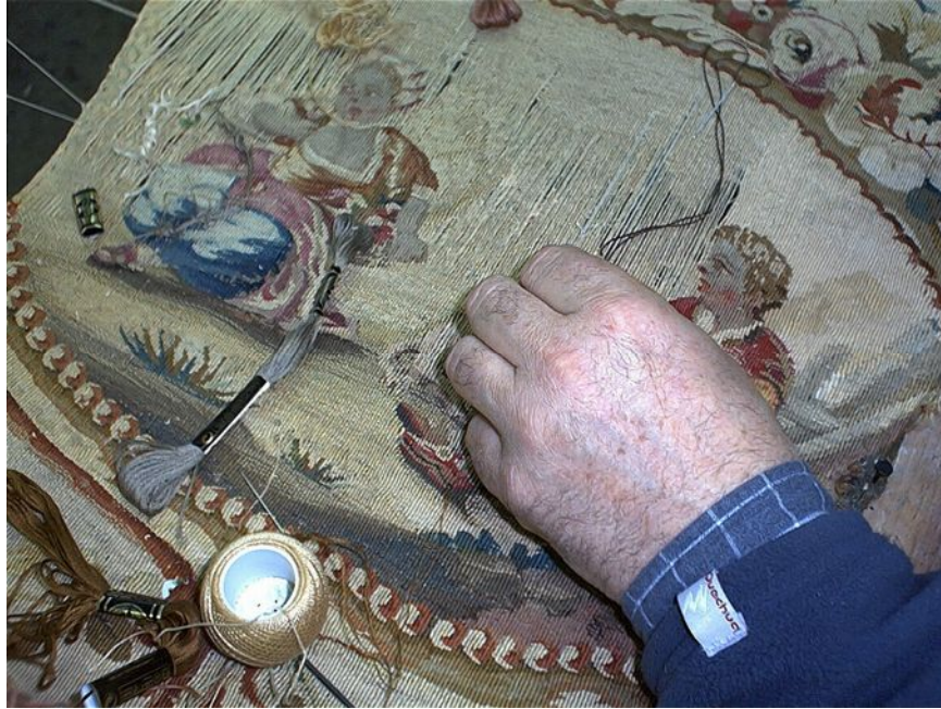
Restauration d'une tapisserie au petit point du 18ème siècle.