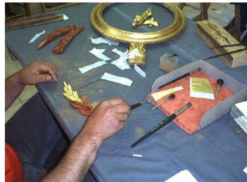
Stage d'initiation à la technique de dorure à la feuille d'or