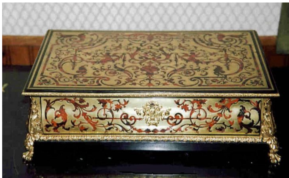
Coffret Louis XIV en marqueterie Boulle