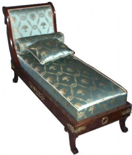
Lit de repos d'époque Empire