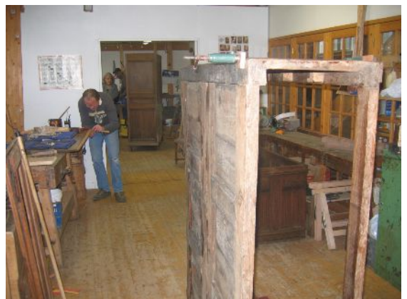
Les ateliers de formation