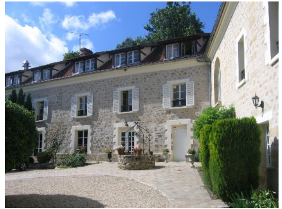
Le centre d'accueil