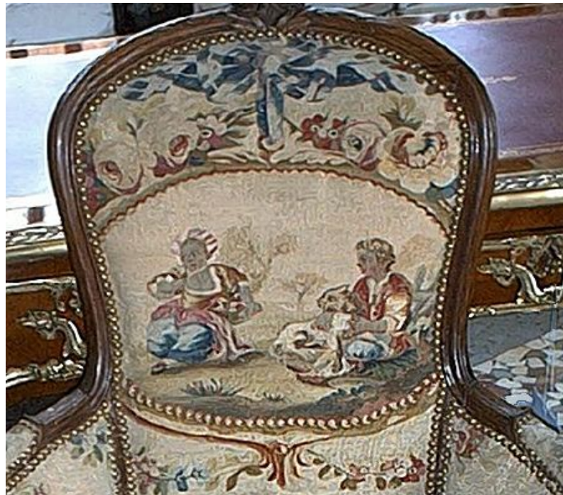
La tapisserie reposée sur la bergère d'époque Louis XV